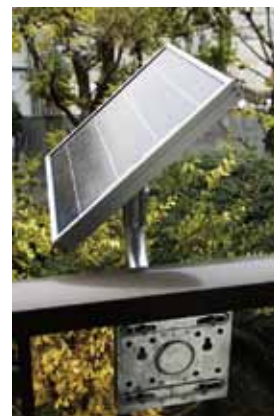
ソーラーパネル取り付け架台