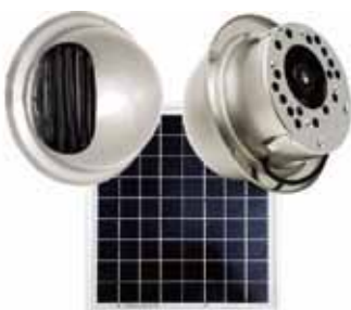
ドーム型シングルユニット