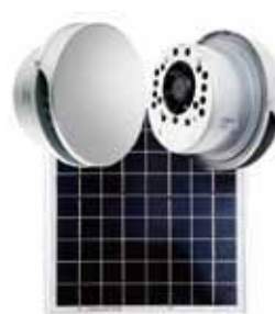
平型カバー付シングルユニット