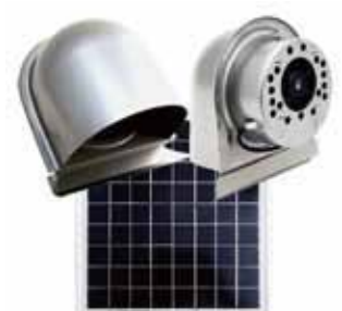
深型シングルユニット