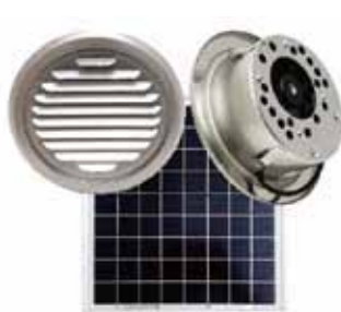
平型シングルユニット