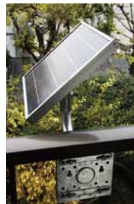
ソーラーパネル取り付け架台

出力： 24時間出力 夕暮れ～夜明け出力 バッテリー： シールド12V 20Ah 寿命2～3年